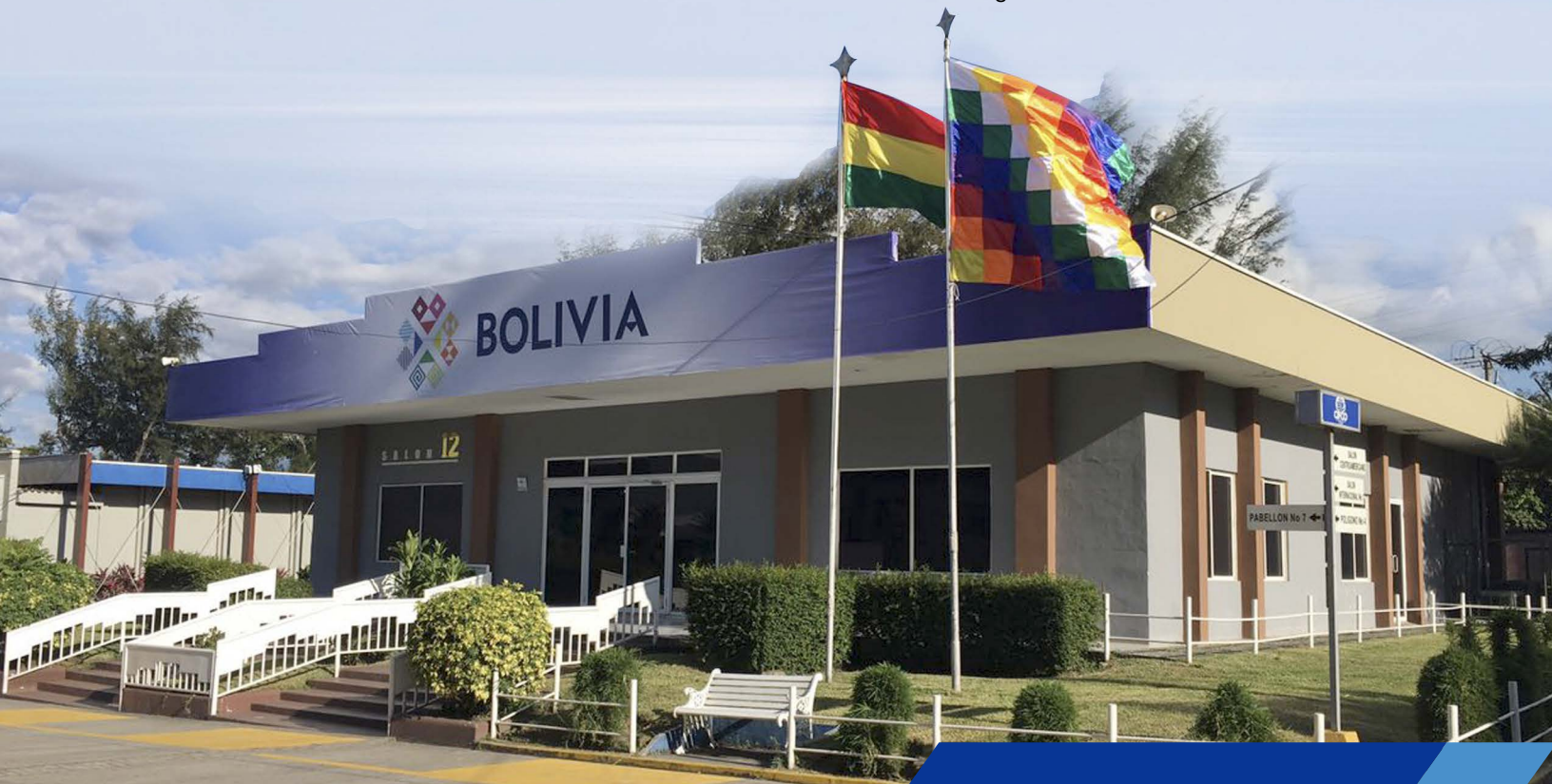
Frontis del Pabellón de Bolivia en la Feria Internacional de El Salvador.