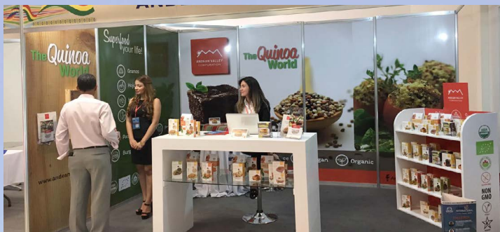
Exposición de productos bolivianos en la XXV FERIA Internacional de El Salvador.