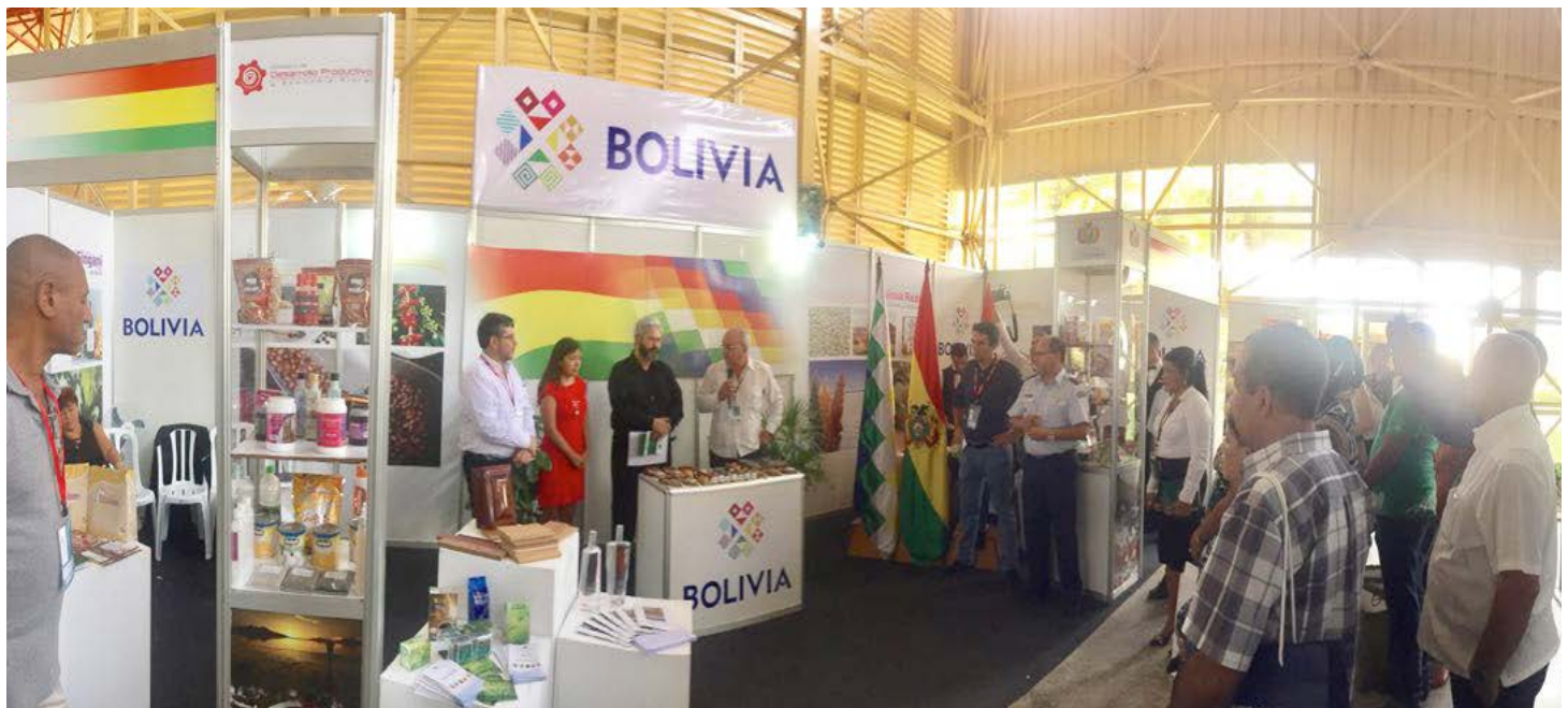
Stand de Bolivia en XXXIV versión de la Feria Internacional de la Habana (FIHAV 2016).

Asimismo, se realizó la distribución gratuita del material impreso y audiovisual informativo sobre las gestiones del Presidente Evo Morales Ayma, momento en el que, el pueblo cubano manifestó su respeto y admiración, hacia nuestro primer mandatario.