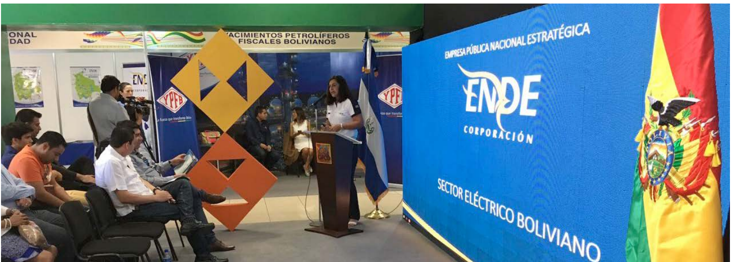
Exposición de la Empresa Nacional de Electricidad (ENDE), en la XXV Feria Internacional de El Salvador.

Las autoridades recibieron una explicación detallada del concepto del pabellón, sus características, el significado de las máscaras y su pertenencia a sus respectivos bailes típicos. Los stands ministeriales, contaron con la presencia y participación del Ministerio de Culturas y Turismo, que presentó la oferta turística